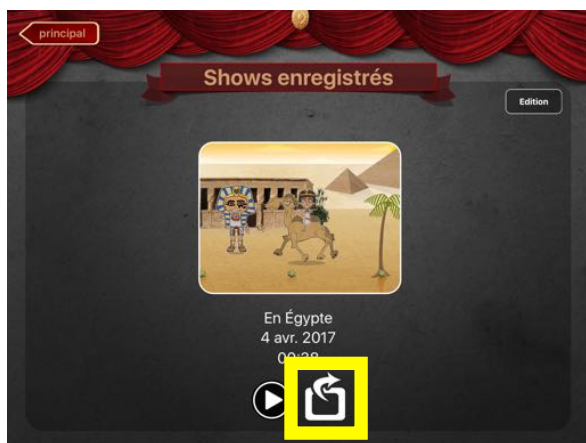
Icône de partage