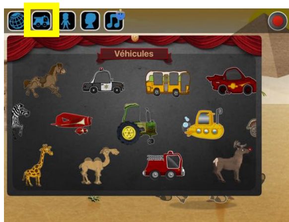
Sélectionner un (ou plusieurs) moyen(s) de transport