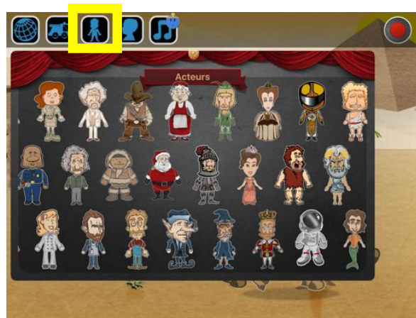
Sélectionner un (ou plusieurs) acteur(s)

L'enfant peut choisir parmi les nombreux acteurs, animaux, véhicules fournis avec l'application; il peut en créer de nouveaux ou utiliser sa photo (4e icône de la barre d'outils) pour apparaître dans l'histoire. Pour supprimer un élément de la scène, il faut laisser le doigt sur celui-ci et le glisser vers la corbeille.