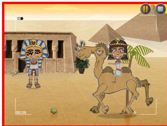
Cadre rouge = enregistrement en cours

L'application enregistre la réplique mais également les changements de pose et déplacements des personnages; pendant l'enregistrement,