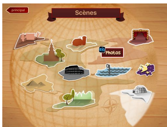
Sélectionner un décor