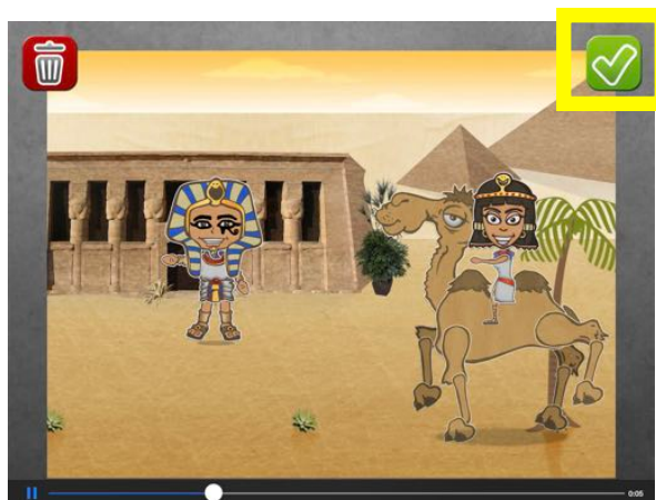
Après visualisation, l'icône verte V permet de sauver.