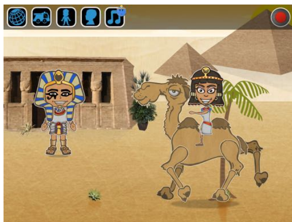
Activer la corbeille efface l'enregistrement, non la scène