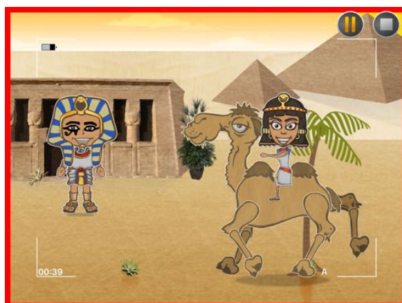
Cadre rouge = enregistrement en cours