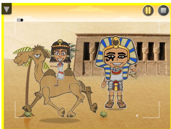
Cadre jaune = pause dans l'enregistrement

Pour faire une pause durant l'enregistrement, l'enfant touche l'icône des deux barres verticales jaunes en haut à droite: un cadre jaune apparaît autour de la scène; pour relancer l'enregistrement, il touche à nouveau l'icône PAUSE.