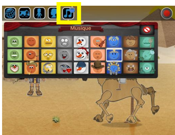
Une musique en accord avec le décor est sélectionnée

Les ambiances sonores sont symbolisées par des émoticônes. Par défaut, une musique en accord avec le thème est sélectionnée; pour supprimer la musique de fond, l'enfant touche l'icône du sens interdit.