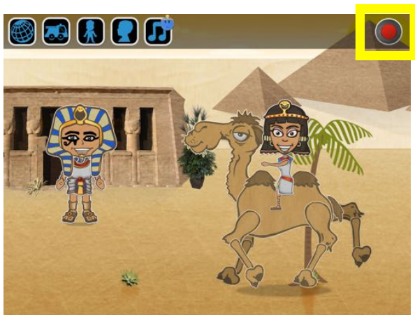
La scène prête pour l'enregistrement

Pour faire parler un personnage, l'enfant touche le bouton de rouge en haut à droite.