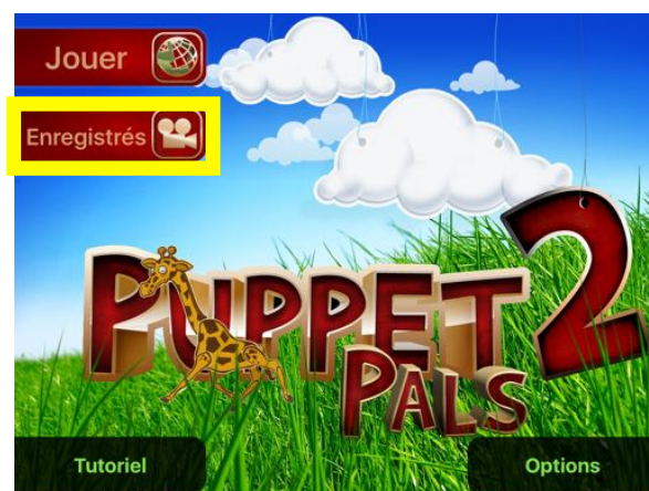
Les films sauvegardés sont visibles dans « ENREGISTRÉS »