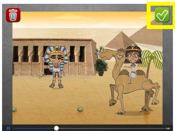
Après visualisation, l'icône verte V permet de sauver.

Une fois l'enregistrement terminé, l'enfant appuie sur sur le l'icône verte en haut à droite pour sauvegarder son film dans l'application.