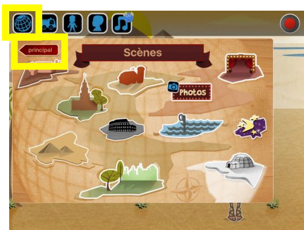
Le bouton principal dans l'écran Scènes

Les animations sauvegardées dans l'application Puppet Pals sont visibles en revenant à l'écran de démarrage (touchez l'icône Scènes puis le bouton principal) puis en touchant le menu « ENREGISTRÉS ».