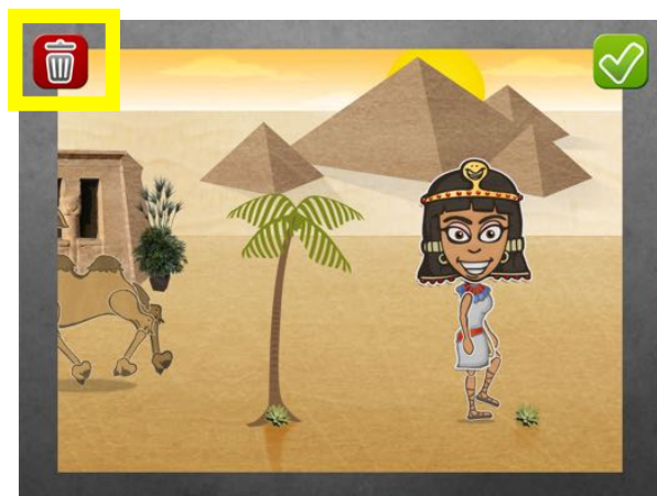
Visualisation de l'animation

En cliquant sur la corbeille, l'enregistrement est effacé et l'application affiche la scène prête pour un nouvel enregistrement.