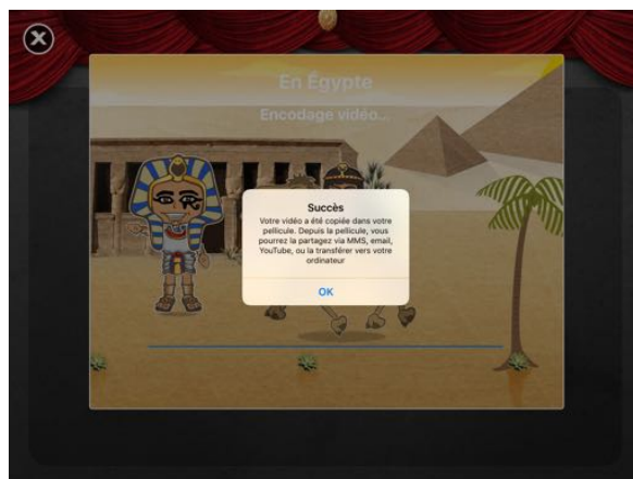
Message de confirmation