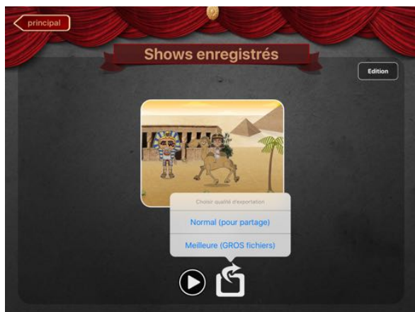
Sélectionner la qualité d'exportation