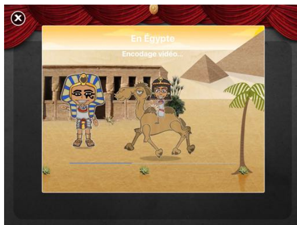
Compression de la vidéo