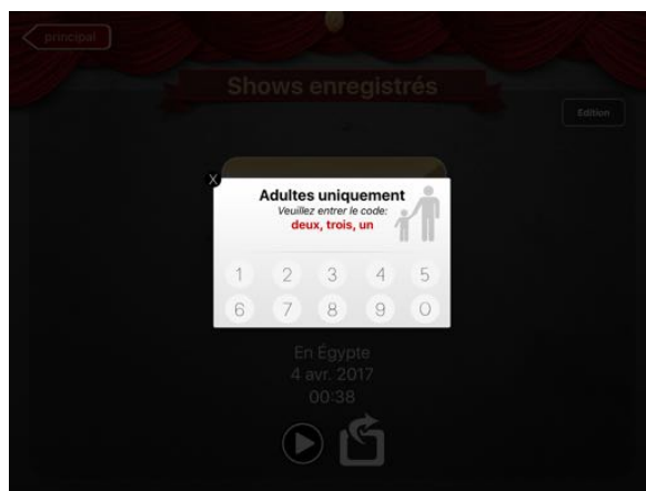
Encoder la suite de chiffres