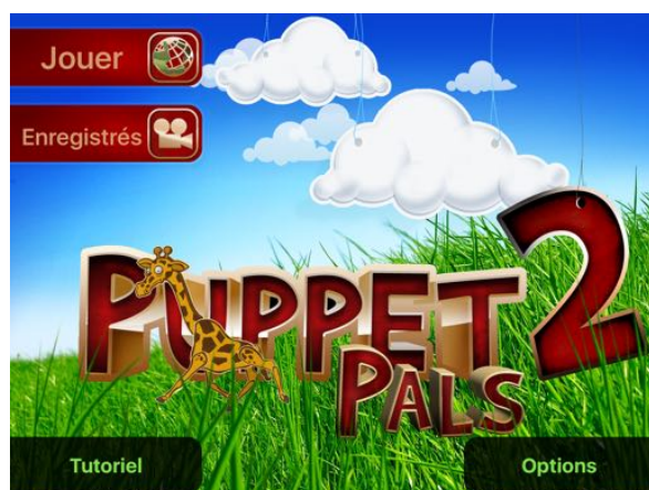
Écran de démarrage

Il est possible de sélectionner un décor proposé par l'application ou de prendre une photo de son environnement et de l'utiliser comme décor.